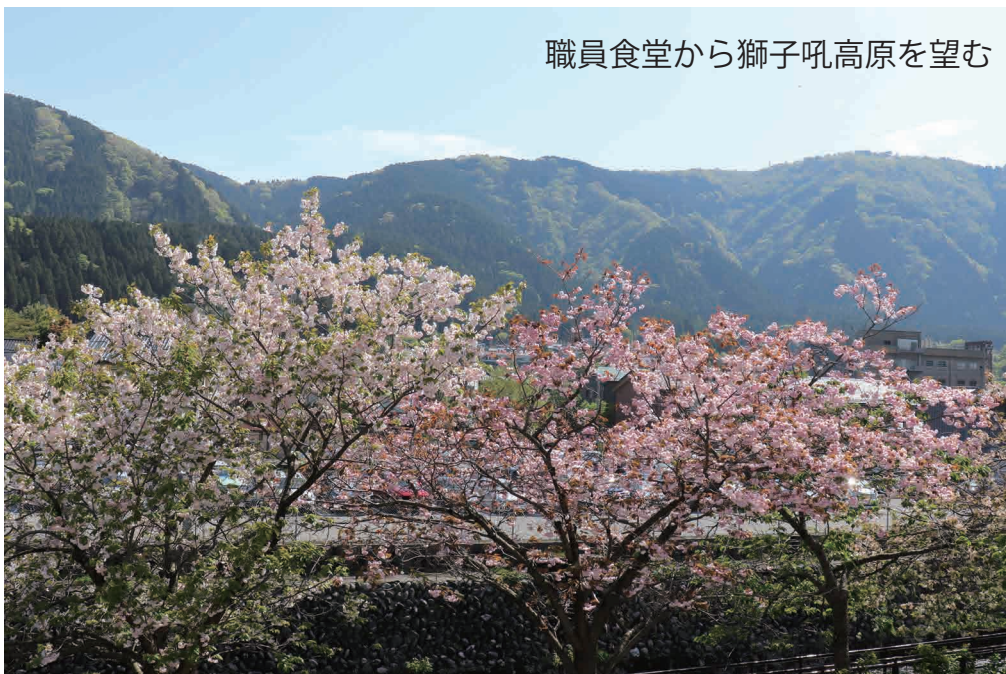
職員食堂から獅子吼高原を望む