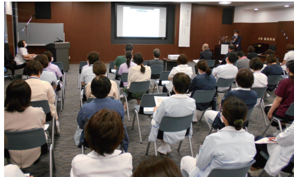
松任石川中央病院 1階講義室