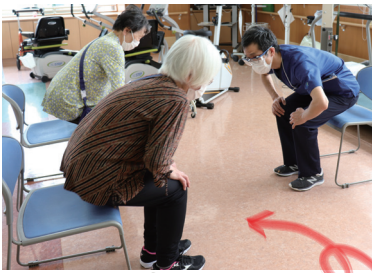
筋力トレーニング

心臓リハビリテーション（心臓リハビリ）とは、心臓病の患者さんが、体力を回復し自信を取り戻し、快適な家庭生活や社会生活に復帰するとともに、再発や再入院を防止することをめざしておこなう総合的活動プログラムのことです。