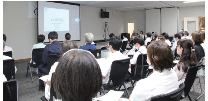
つるぎ病院 2階会議室