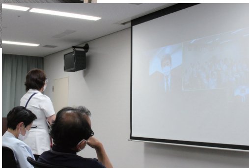
つるぎ病院とリモートでの質疑応答