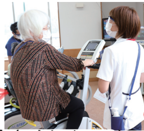
有酸素運動（マシンメニュー）