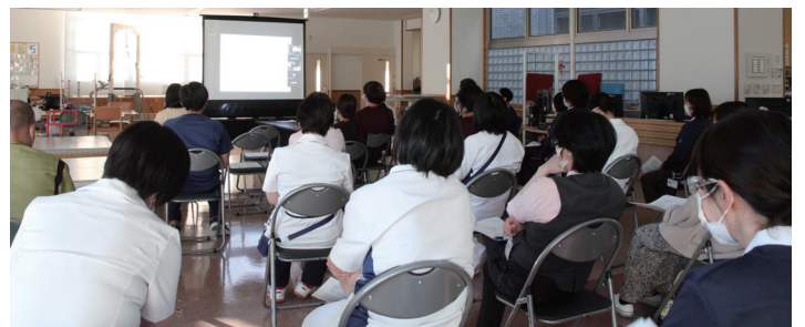
つるぎ病院 リハビリテーション室